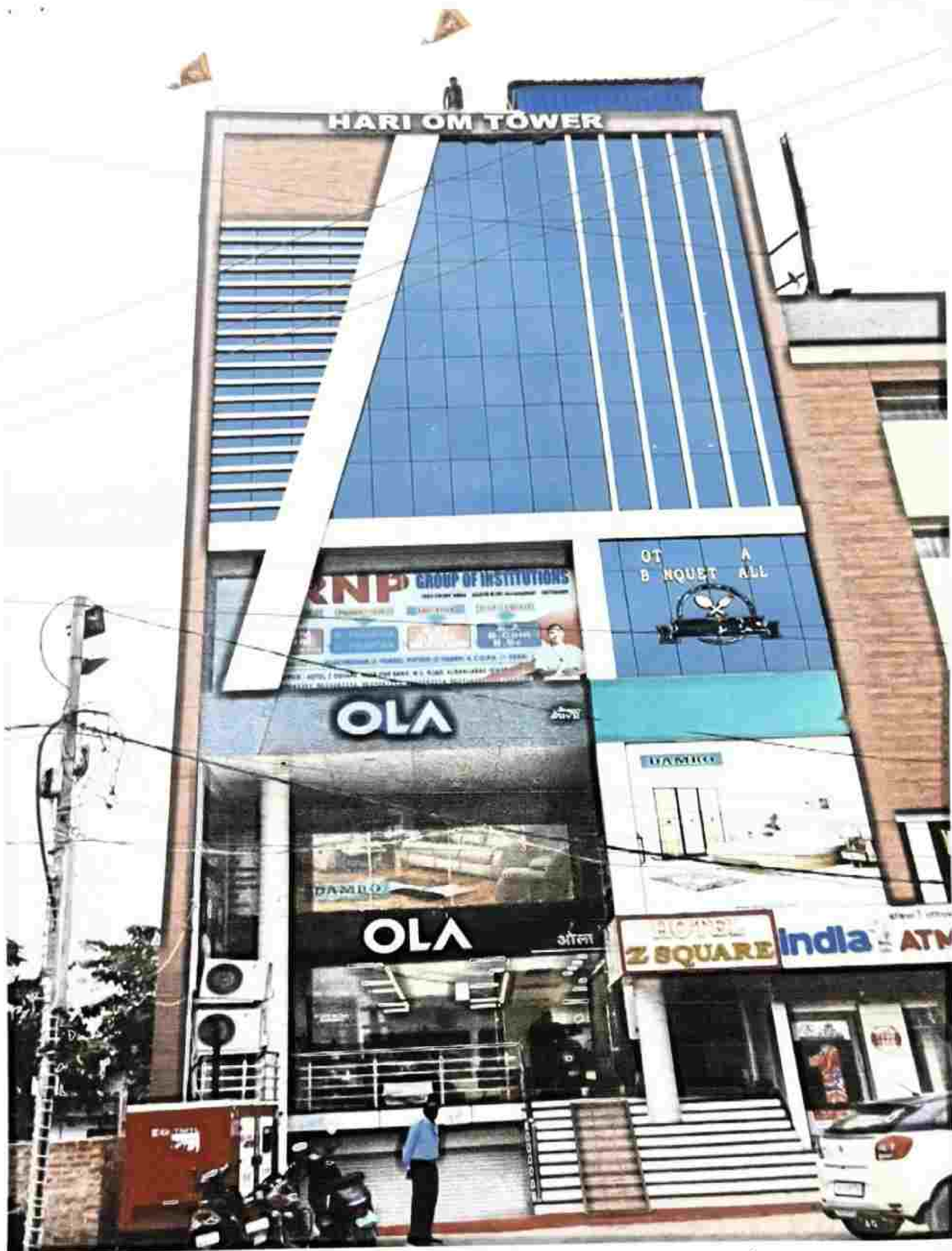
* Hotel Facility (Hotel 2 Square) *

Chandrasekhar IQAC D.P.R.P. B.Ed. College Chitragopi, Aurangabad